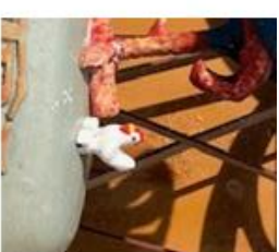
Høna gjester hanen hos Avlangrud.