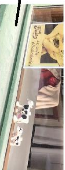
Kua og kalven ser på melkesjokolade hos Narvesen.