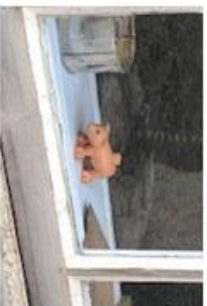
Grisen liker seg hos maleren.