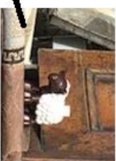
Sauen er på apoteket.