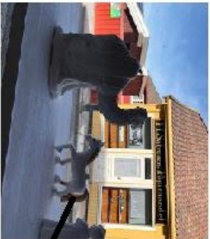
Hesten titter innom Salvesen og dromedaren.