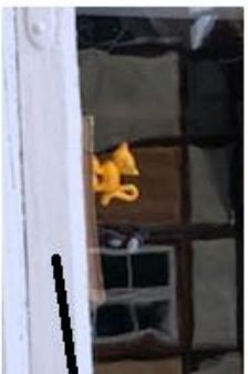
Kattene gjester seg i Olsengården.