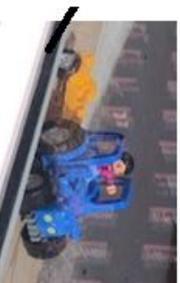
Bondekona titter på Postbilen.