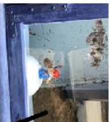
Bonden koser seg hos bakeren.